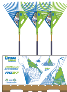
Pésentoir 48 x 40 avec 40 unités